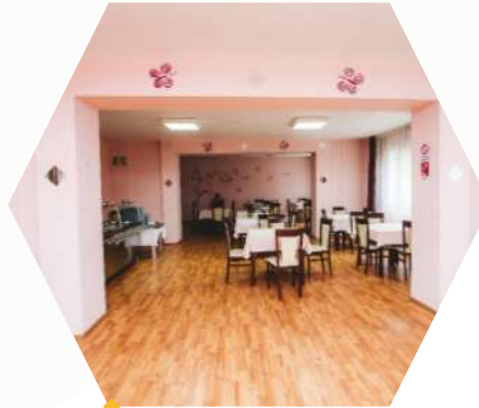
Sală de mese de tip restaurant